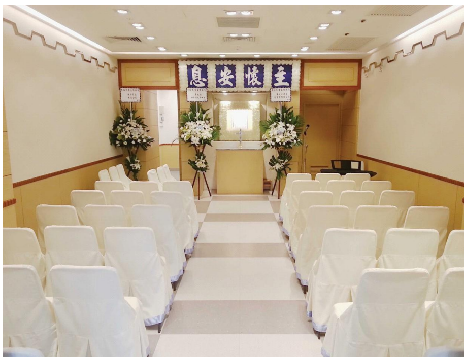
守夜靈寢室 (可容納20-40人)