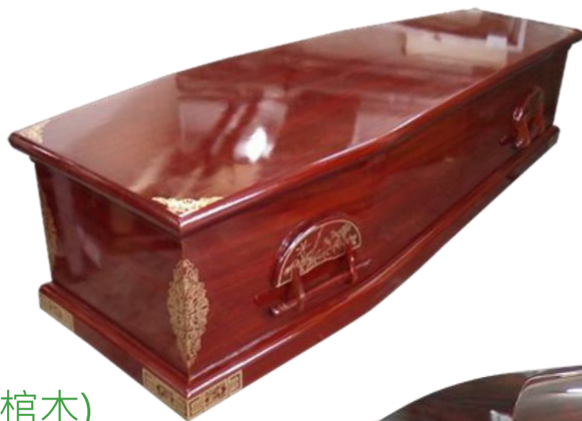
標準棺木(柩型棺木)