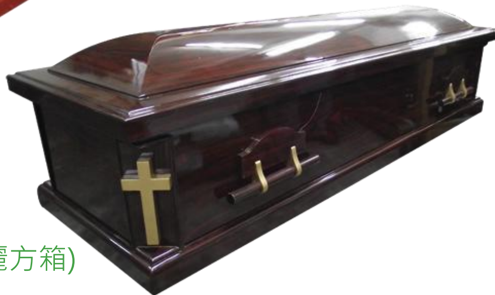
標準棺木(綺麗方箱)