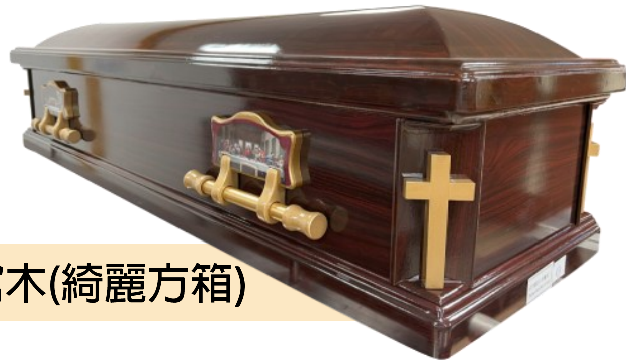
標準棺木(綺麗方箱)