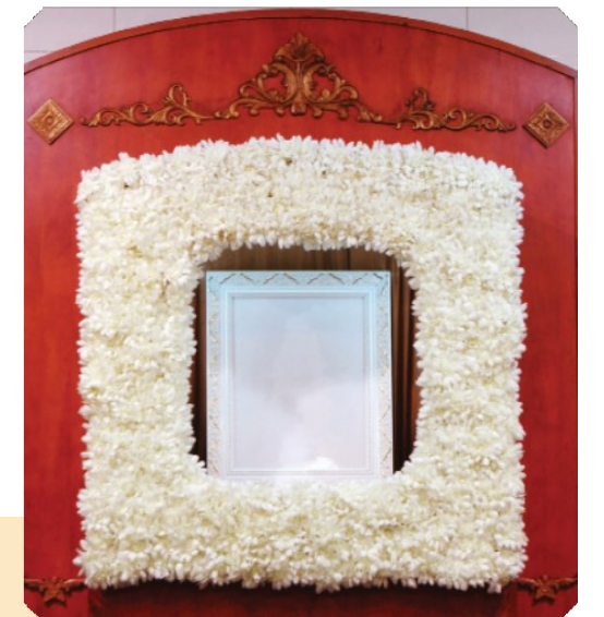
標準佈置全套 (包括靈寢室或禮堂橫額佈置、相架佈置)