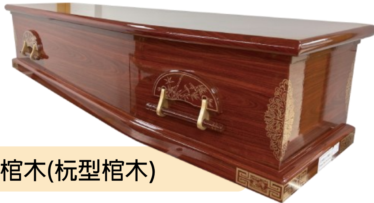
標準棺木(柩型棺木)