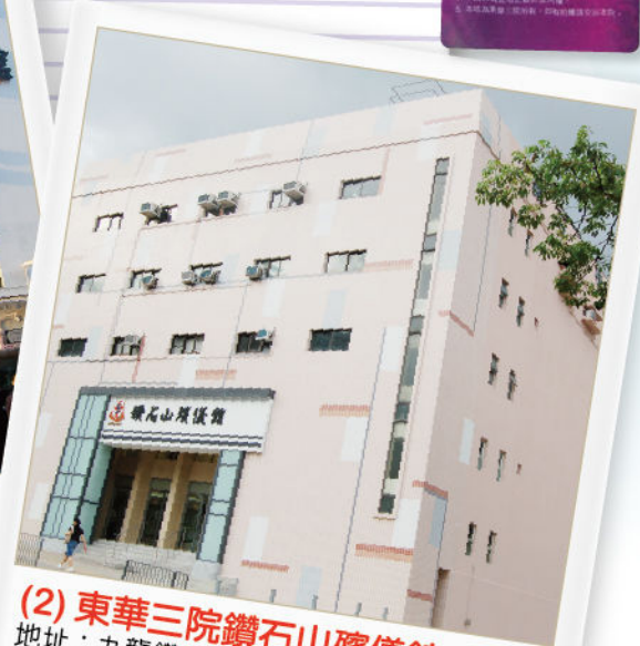
(2) 東華三院鑽石山殯儀館 地址：九龍鑽石山蒲崗村道181號 電話：2326 0121