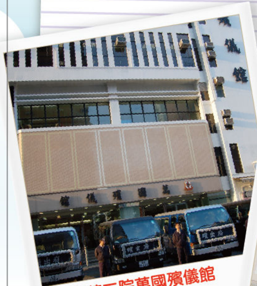
(1) 東華三院萬國殯儀館 地址：九龍紅磡暢行道8號 電話：2303 1234